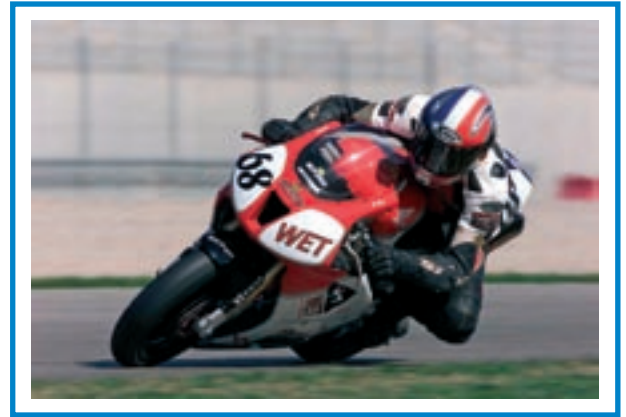
Valencia - Superbike 2002