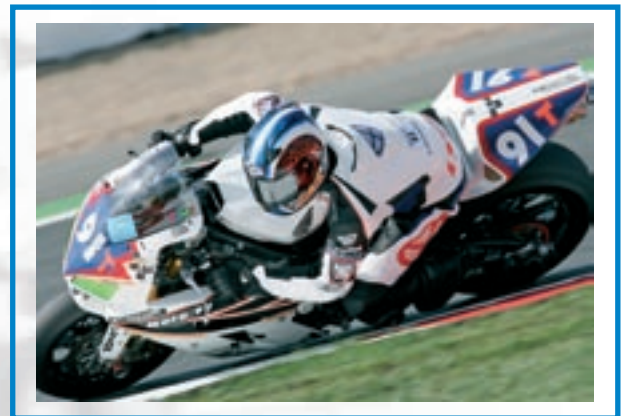
Magny Cours - Bol d'Or 2005